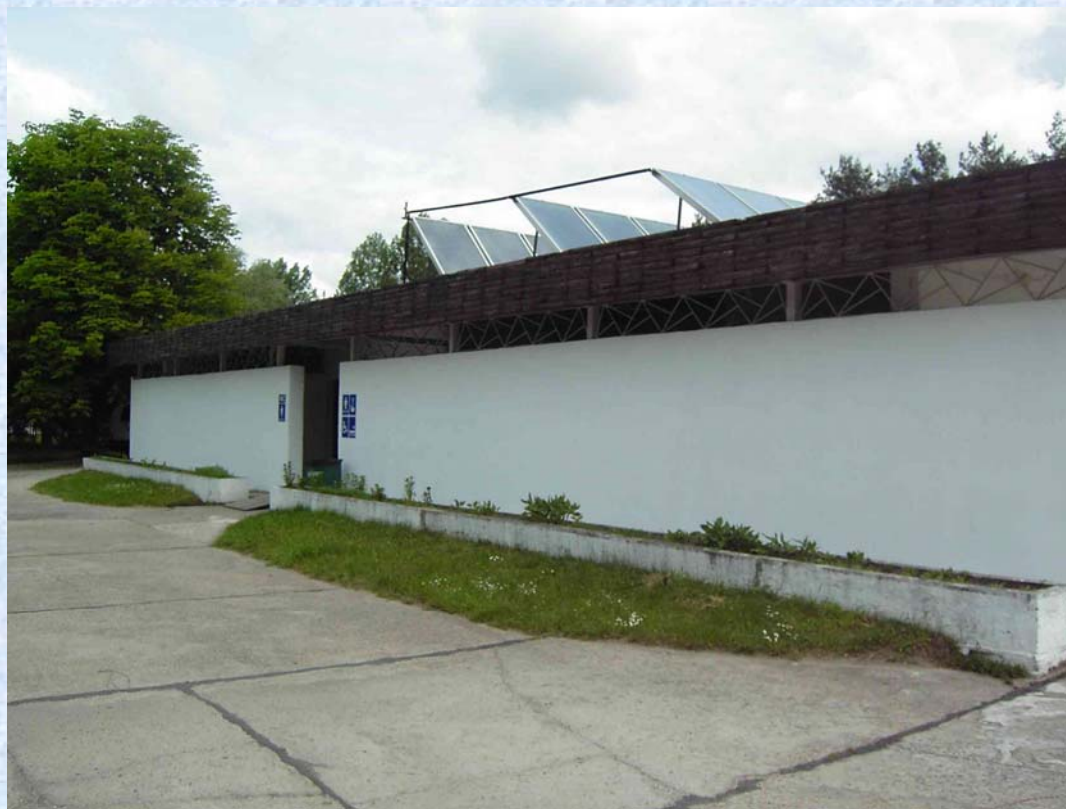
Wejście do pomieszczenia z armaturą kolektora