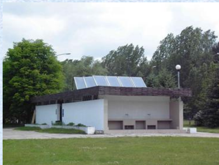
Widok ogólny kolektora słonecznego