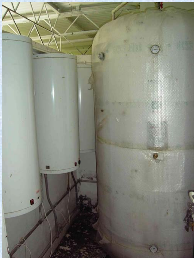
boilery i zbiornik c.w.u.